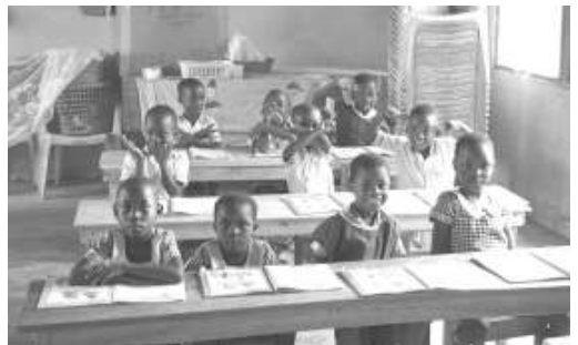
Center für frühkindliche Entwicklung

Durch das Fundraising der deutschen CVJM (Einsammeln von Weihnachtsbäumen, CVJM-Cafés, Basare etc.) wurde es einer ganzen Reihe von Vereinen in Ghana möglich, ihre eigenen Häuser zu bauen und darin Kindergärten, Kindertagesstätten, Schulen und Hostels zu betreiben. Dem CVJM-Westbund ist diese vielgestaltige Partner-