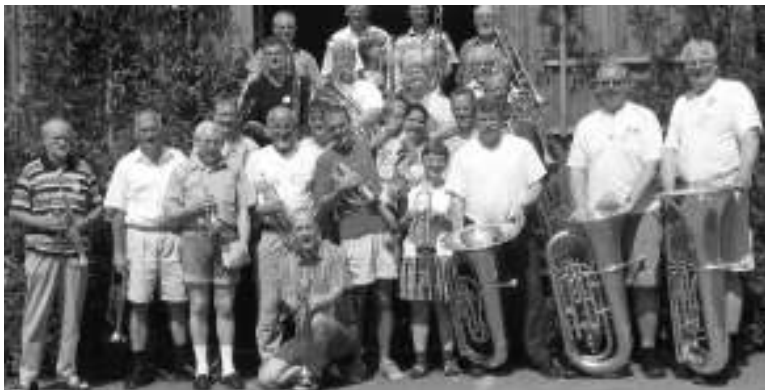
Chortreffen zwischen dem CJV Bazuin-groep Vlaardingen und unserem Posaunenchor 2003 in Berchum

Die CJV Bazuin-groep, die ursprünglich als christlicher Posaunenchor auf der Basis der damaligen Bläserliteratur des CVJM-Westbundes ge- →