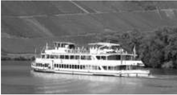
Das könnte unser nächster Vereinsausflug sein

Am Samstag, den 26. August , treffen wir uns um 13.45 Uhr am Bootsanleger am Freibad in Wetter,